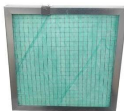
Filtre à poussières FPP1