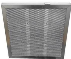
Filtre à charbon actif FCP1