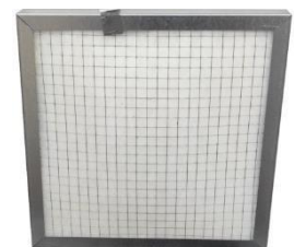
Filtre à particules FAP1